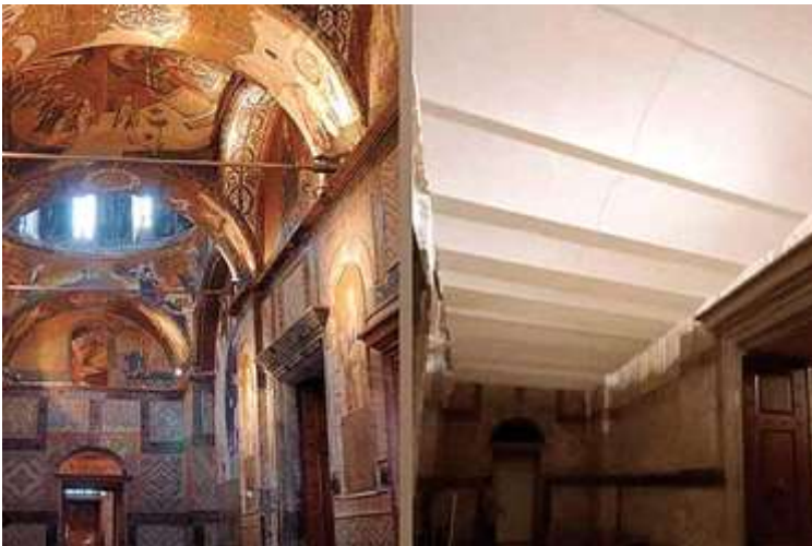
Ο ιερός Ναός Χριστού Σωτήρος της Μονής της Χώρας στην Κωνσταντινούπολη πριν και μετά από τις πρόσφατες παρεμβάσεις

Για να διασφαλιστεί ότι λαμβάνονται αποτελεσματικά και ενεργά μέτρα για την προστασία, τη διατήρηση και την παρουσίαση της πολιτιστικής και φυσικής κληρονομιάς που βρίσκεται στην επικράτειά του, κάθε Κράτος Μέρος της παρούσας Σύμβασης καταβάλλει προσπάθειες, στο μέτρο του δυνατού, και κατά περίπτωση για κάθε χώρα.